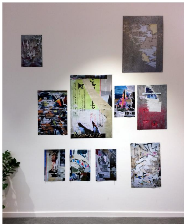
L'exposition « Mémoire des murs, faire parler les murs-palimpseste ».