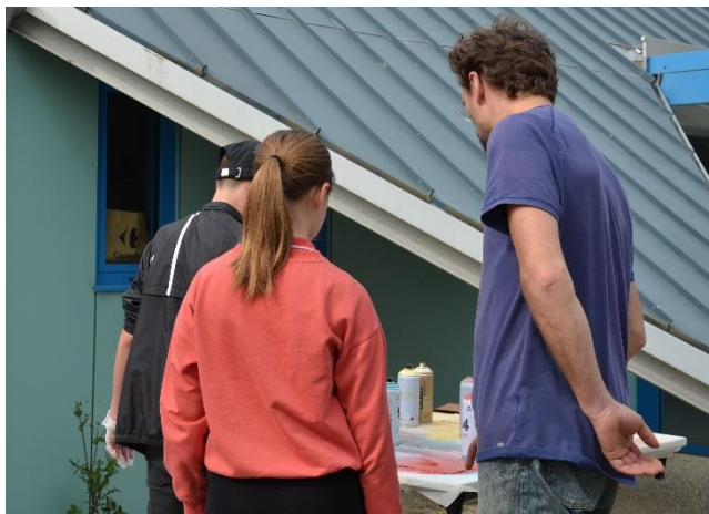
Séance de composition avec les jeunes de la maison de pyramide à Lagnieu.