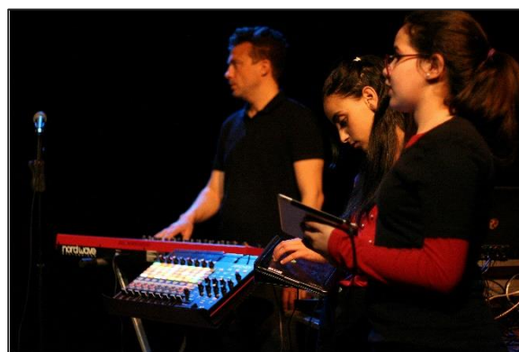
Restitution du projet « Nouvelle aurore » avec des élèves allophones à Bourg-en-Bresse.