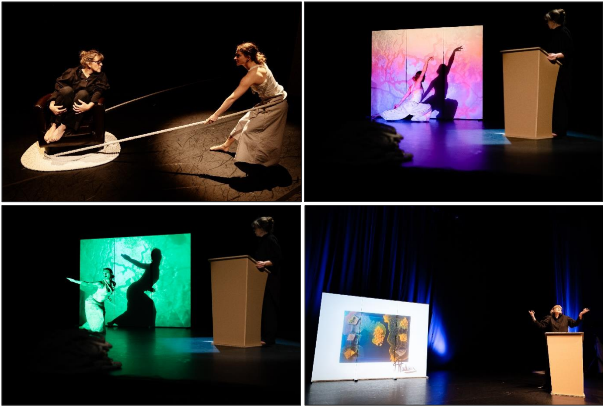
La première du spectacle BLOB au Théâtre de l'Uchronie à Lyon, en avril 2023.