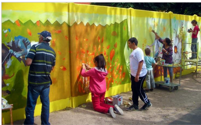
Projet de fresque à Villefranche-sur-Saône, avec la participation de 300 habitants de tous les âges. © Passe Mural