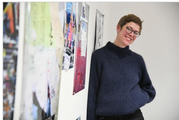
Portrait de l'artiste à l'exposition « Mémoire des murs, faire parler les murs-palimpseste ».