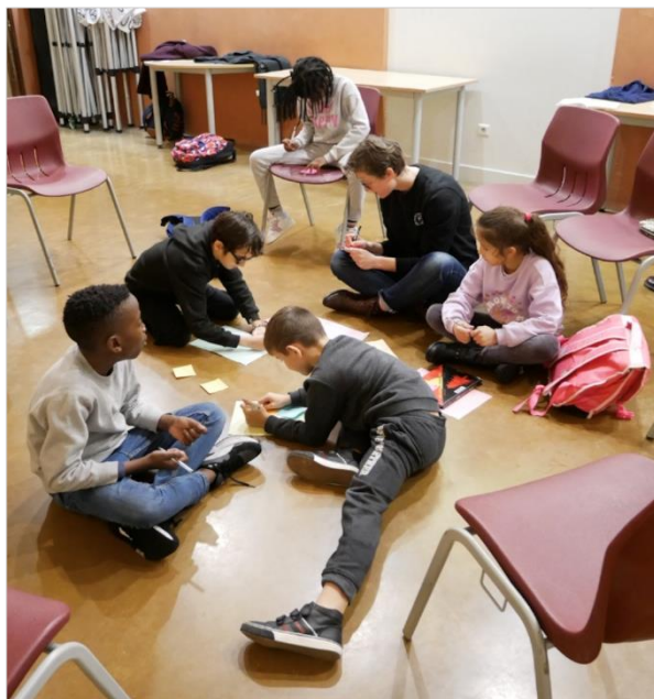
Projet participatif « Mémoire des murs, faire parler les murs-palimpseste » de Claire Georgina Daudin.