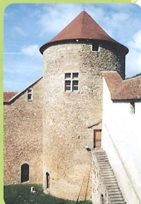
St Rambert en Bugey

LEGENDE LUNDI → secteur A (Rose) MARDI → secteur B (Jaune) MERCREDI → secteur C (Bleu) VENDREDI → secteur D (Vert)